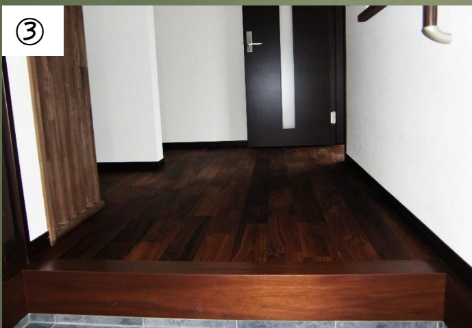
③ブラックウォールナット120巾施工当初(2011年3月)