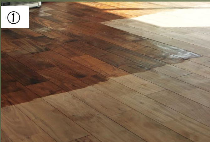
①ブラックウォールナット120巾オイル塗布途中(2011年3月)

『わたしが家を建てる時は、世界三大銘木の一つ、ブラックウォールナットのフローリングを使いたい。』と心に決めた営業マンが10年前ついに夢を叶えました。高い耐久性や耐水性等の利点が多く欠点が少ない事はもちろん、何といたってもその色に魅力を感じたその人は、10年過ぎた今もさらにブラックウォールナットのフローリングを絶賛しています。床の隙間があくことはほぼなく安定しており、色はブラックからブラウンになって(写真④・⑤)経年変化を楽しんでいる様です。メンテナンスについては、自分で3年に一回自然オイルを塗っています。営業マンでもある彼が『ブラックウォールナットは少々値段は高いですが、毎日長く生活するリビングには、ぜひともウォールナットのフローリングを!』とお薦めしております。