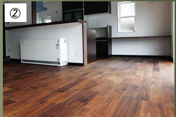
②ブラックウォールナット120巾オイル塗布後(2011年3月)